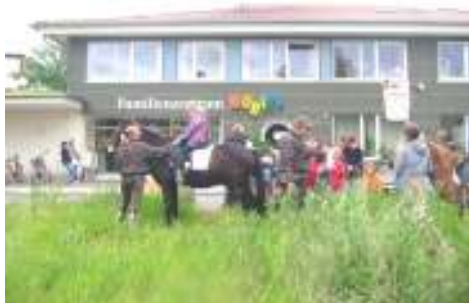
Bilder vom Sommerfest 2010