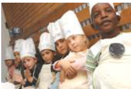
Hier sind Hemelinger Kinder bei einem anderen Quartier-Projekt schwer aktiv!